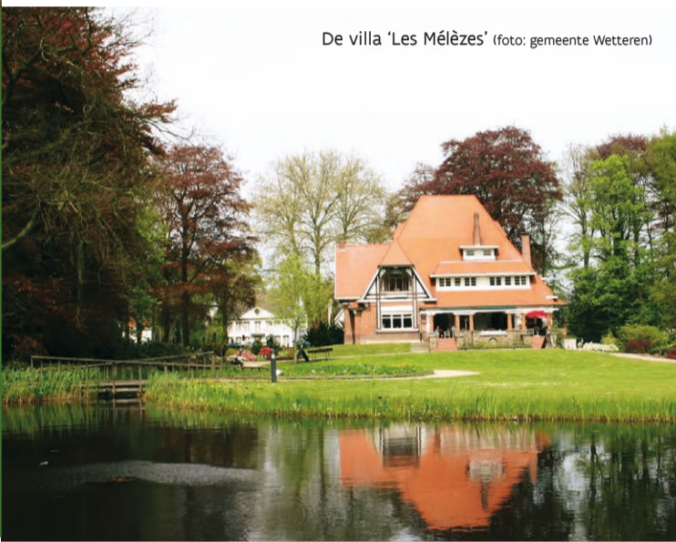
De villa 'Les Mélézes'