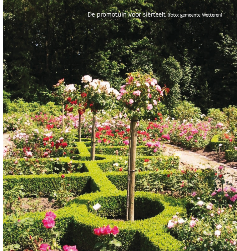
De promotietuin voor sierteelt

De Warandeduinen is een erkend zaadbestand voor zomereiken. Hierdoor liggen in en rond de duinen in het najaar ook netten om deze eikels op te vangen.