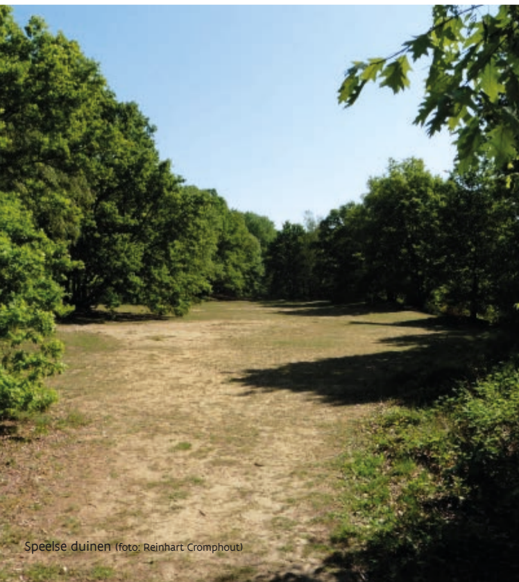
Speelse duinen

In de loop der jaren werden de Warandeduinen bebost en kreeg de wind steeds minder vrij spel om met de duinen op de loop te gaan. Daarom zal het Agentschap voor Natuur en Bos op bepaalde plaatsen rondom de duinen stukken jong bos rooien, zodat de wind weer zijn werk kan doen.