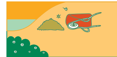
Les plantes s'échappent par les déchets de jardin.