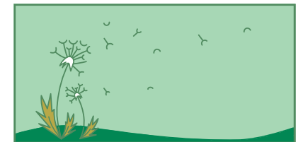
Le vent disperse des graines.