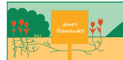
Les plantes s'échappent directement de jardins et de parcs.