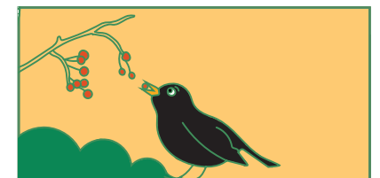
Les oiseaux dispersent des graines.