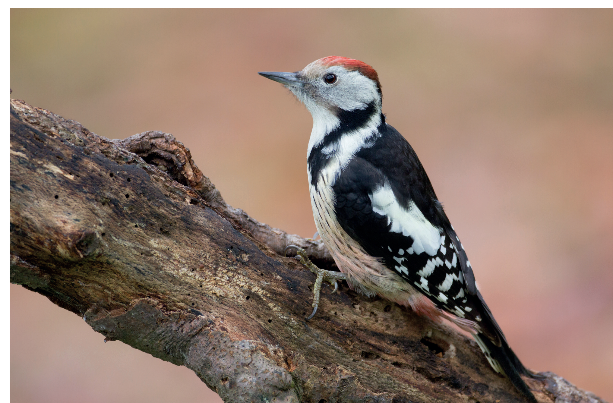
Middelste bonte specht