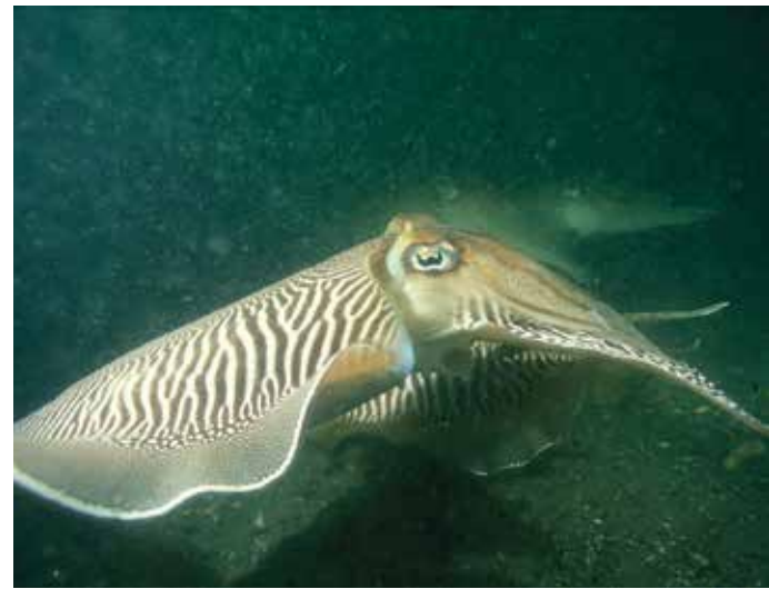
Boven: Een primaire duin begroeid met zeeraket. Onder: De vloedlijn ligt bezaaid met rugschilden van de zeekat, een inktvis uit onze Noordzee.

dijk heeft zich uiteindelijk de duinen-gordel gevormd die je nu ziet. Daar kon de zee niet meer door en zo raakte dit stuk ingesloten, en op termijn gevuld met regenwater. Een uniek fenomeen aan de Belgische kust.”