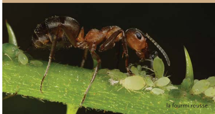
la fourmi rousse

Un aspect remarquable sont les dômes de nidification (fourmilières) de la fourmi rousse protégée, une espèce vivant en bord des bois qui est unique dans une grande partie des environs. Les fourmis rouges éliminent les cadavres d'animaux et chassent entre autres les chenilles.