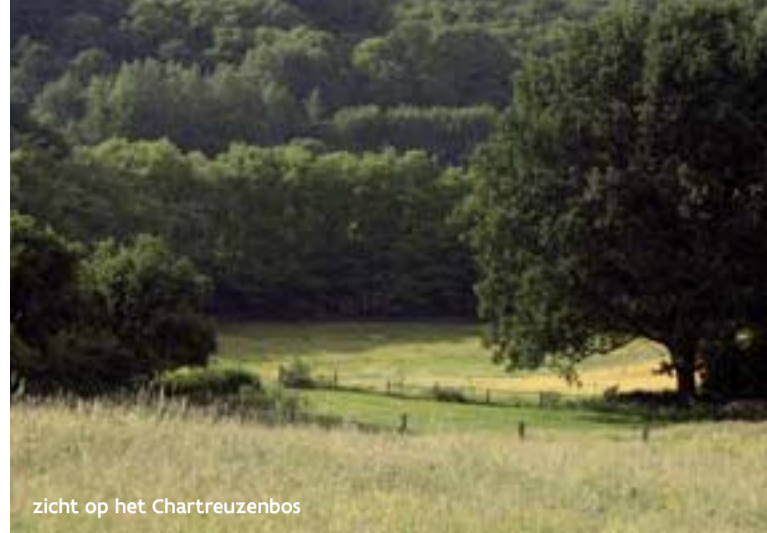
zicht op het Chartreuzenbos

Vanaf oktober 2020 kan je je ook onderdompelen in een heerlijk bosbad en volledig tot rust komen in de gloednieuwe natuuroase, de plek bij uitstek om te mediteren en de batterijen opnieuw op te laden. Het parcours van de natuuroase (ca. 3,5 km) vertrekt aan de kleine parking op het kruispunt van de Meidries en de Lindestraat in Holsbeek.