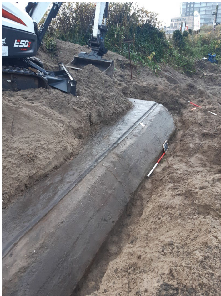
Een bunker uit de Eerste Wereldoorlog die aan het licht komt bij graafwerken voor het LIFE DUNIAS-project in Blankenberge.