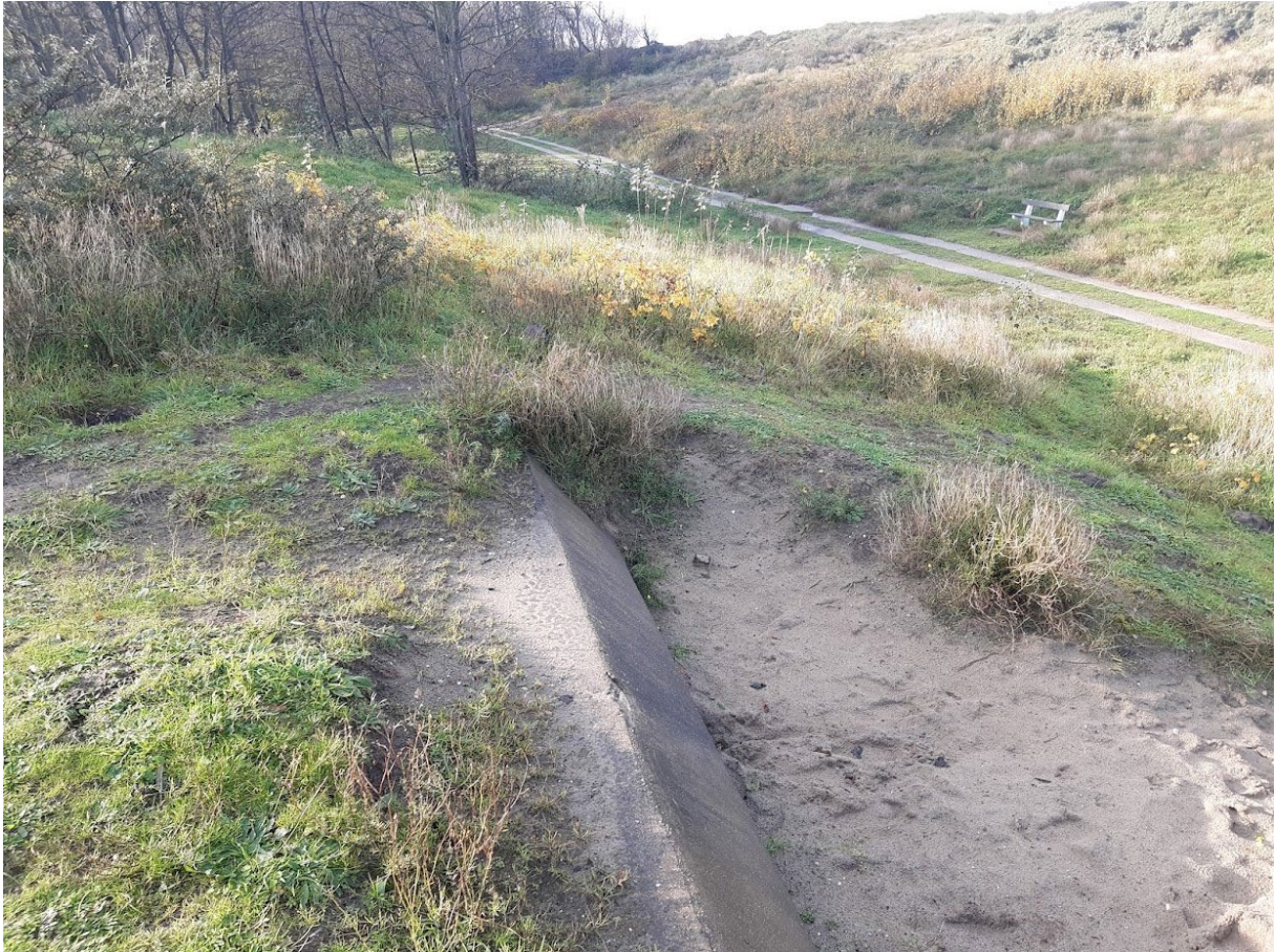
Een bewaarde bunker uit de Tweede Wereldoorlog in het Generaal-Dirceur Willemspark in Heist.