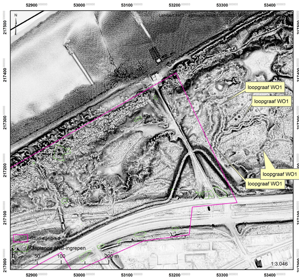
Bewaarde loopgrachten uit de Eerste Wereldoorlog in Bredene, zichtbaar op digitale hoogtekarten.