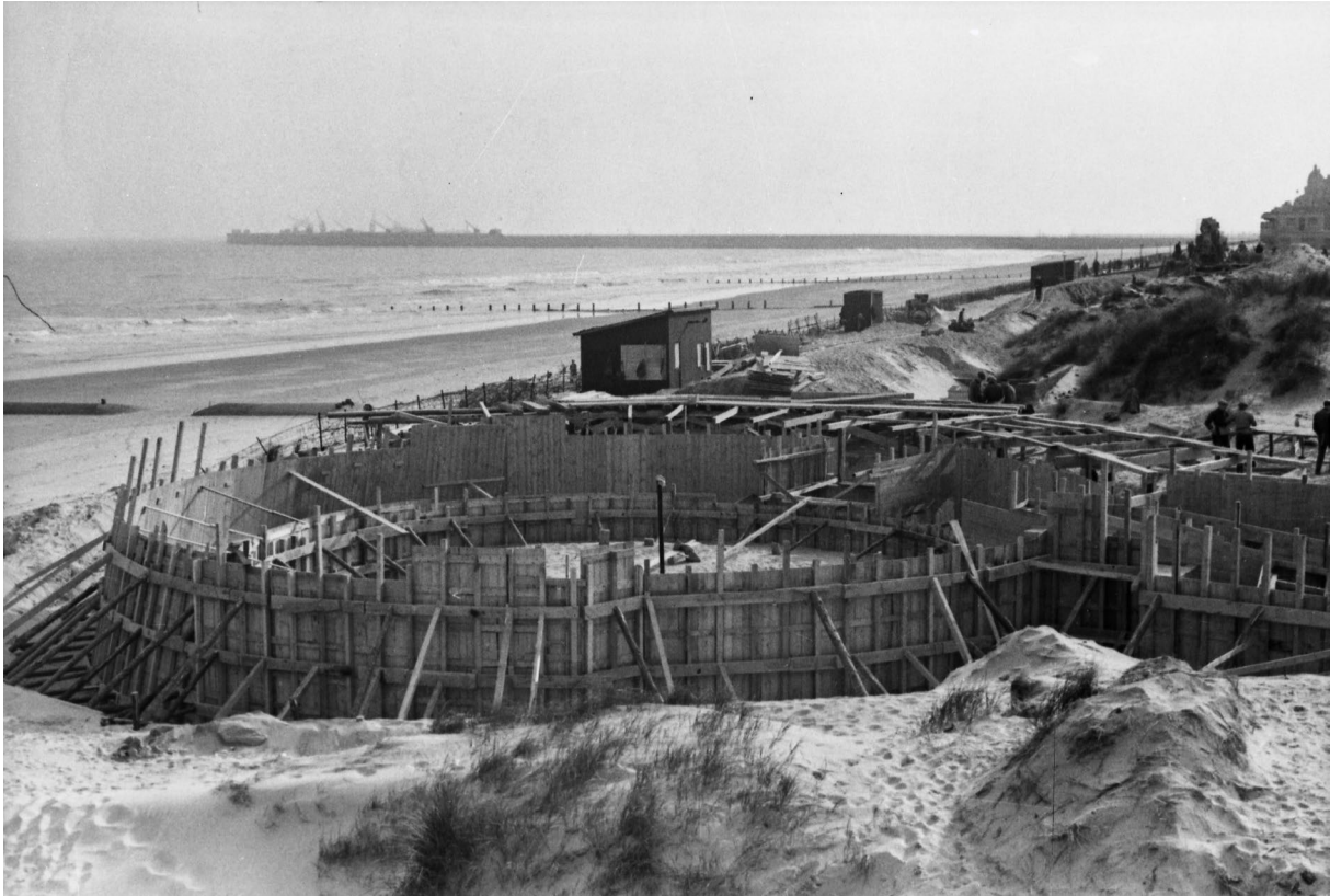
Geschutsofstelling in opbouw in de Fonteintjes, Zeebrugge, Tweede Wereldoorlog.