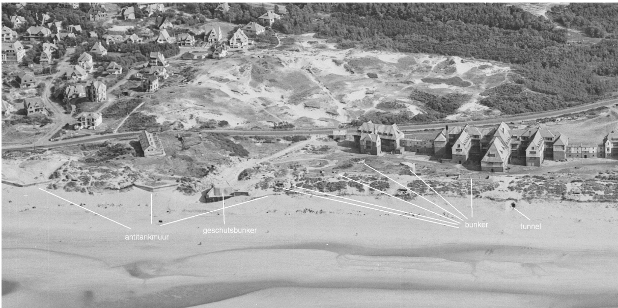
Versterkingen rond het Zeepreventorium in De Haan in de Tweede Wereldoorlog. Uit: STICHELBAUT, B., GHEYLE, W., CORNILLY, J. & DE MEYER, M., 2021. De kust 4 augustus 1945. De zomer van de vrijheid. Unieke luchtfoto's van Knokke tot De Panne. Gent: Tijdsbeeld.