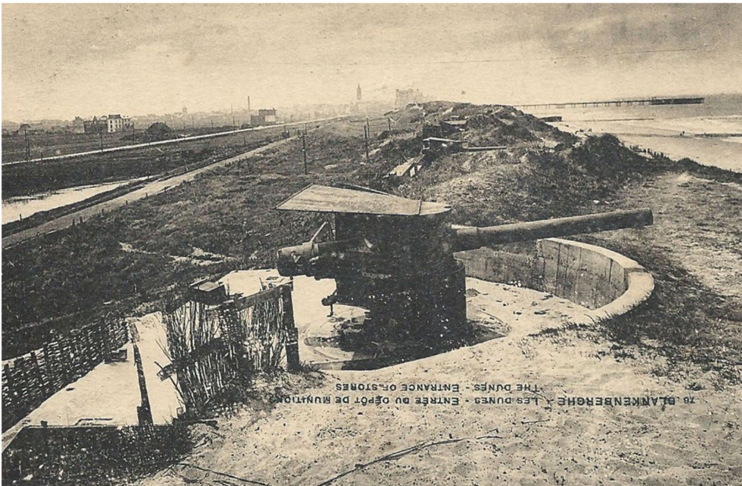
De Fonteintjes (Blankenberge/Zeebrugge) in de Eerste Wereldoorlog: Batterij Kaiserin.