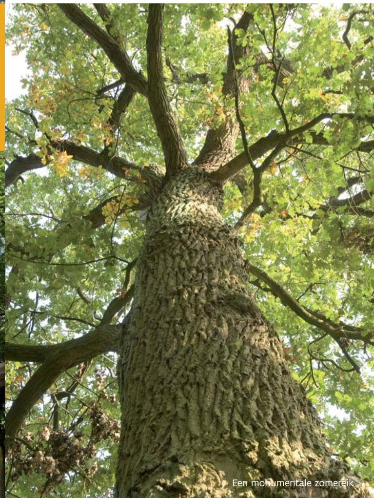
Een monumentale zomereik