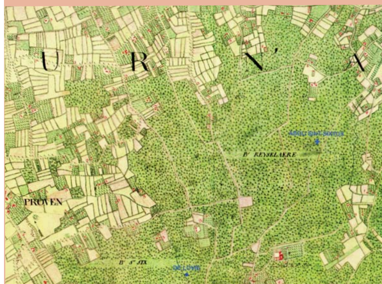
Kaart van Ferraris ± 1780

Een aantal eigenaars kapte bomen en struiken en plantte nieuwe streekvreemde soorten aan. Op de gewestplannen waren de bossen echter ingekleurd als natuurgebied. Een lokale milieugroep, de stad Poperinge en de gemeente Vleteren zetten zich in voor een stedenbouwkundig optreden, waarna de zonevreemde weekendverblijven werden verwijderd.