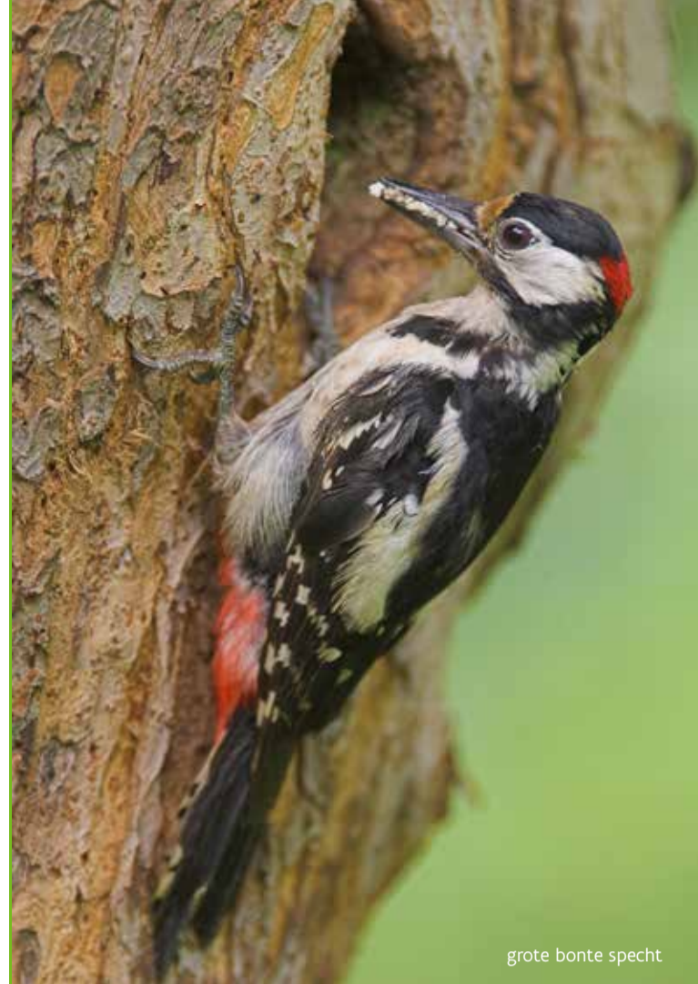
grote bonte specht

Boomklevers en glanskoppen komen hier vrij veel voor. De boomklever klautert schokkerig maar behendig alle richtingen uit op boomstammen, ook ondersteboven. In het bos kun je vier soorten spechten spotten: de kleine, grote en middelste bonte specht, maar ook de groene specht. Kijk goed of je geen buizerd of wespendifie ziet cirkelen. 's Nachts laten bosuil, kerkuil en steenuil van zich horen.