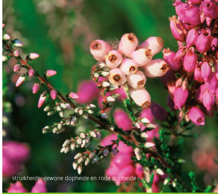
struikheide, gewone dopheide en rode dopheide