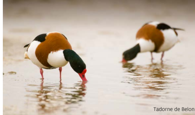
Tadorne de Belon

L'Yser est l'unique grande rivière qui, dans notre pays, se jette directement dans la mer. Dans l'embouchure, l'eau salée et l'eau douce se mélangent et la marée domine. Cela offre 130 hectares de biotopes extraordinaires de slikkes, schorres, dunes, plages et polders. Particulièrement frappants sont les nombreux oiseaux de plage et échassiers, comme le tadorne de Belon, le chevalier gambette, l'huître pie et le courlis cendré, qui viennent chercher de la nourriture et se reposer pendant toute l'année sur la slikke, le schorre et la plage à l'embouchure de l'Yser. Peut-être que lors de votre visite, vous tomberez nez à nez avec un phoque! Chaque hiver, l'on peut apercevoir quelques phoques dans le chenal ou sur la slikke.