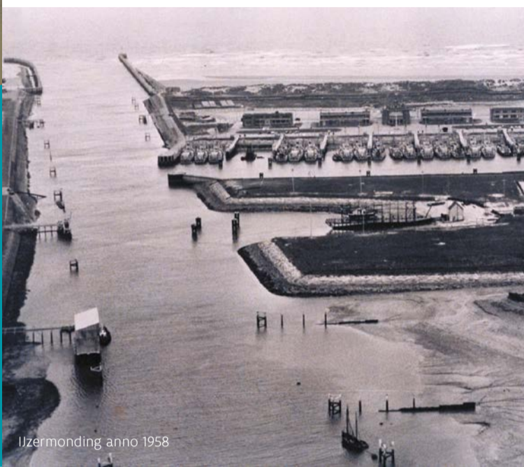
IJzermonding anno 1958