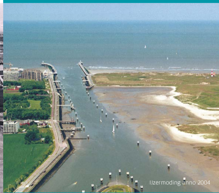
IJzermonding anno 2004

saison de nidification, des centaines d'échassiers qui viennent y faire le plein avant de poursuivre leur route vers leurs zones d'hivernage (barge rousse, chevalier arlequin, bécasseau variable,...) ou qui viennent hiverner ici (chevalier gambette, pluvier argenté, courlis cendré,...). Les poissons, eux, attirent entre autres des grands cormorans et des phoques veau-marin.