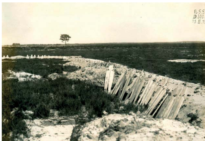
Loopgraven met houten doelwitten op Schietveld Houthalen-Helchteren

Fiets verder naar knooppunt 538, waar je deze lus 2 mogelijk bent gestart.