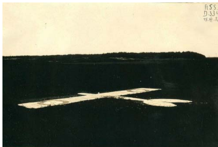
Houten vliegtuig als oefendoelwit