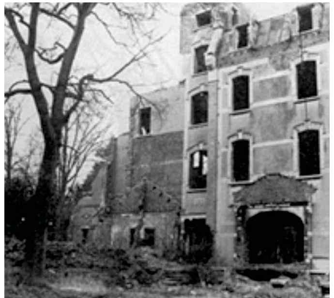
Vervallen landhuis Domein Masy