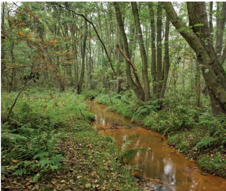
Vallei van de Mangelbeek

Rij verder in de richting van knooppunt 512. De bossen, die je ondertussen ziet én de mijnterrils van Waterschei, zijn grotendeels in beheer bij het Agentschap voor Natuur en Bos. Van op de top van de terril heb je een fenomenaal zicht op het landschap. Eventueel kan je voor deze fikse wandeling eens terug komen?