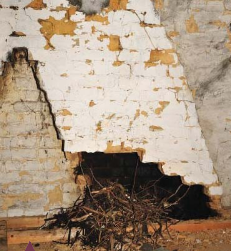
Nestmateriaal kauw bij afbraak schouw