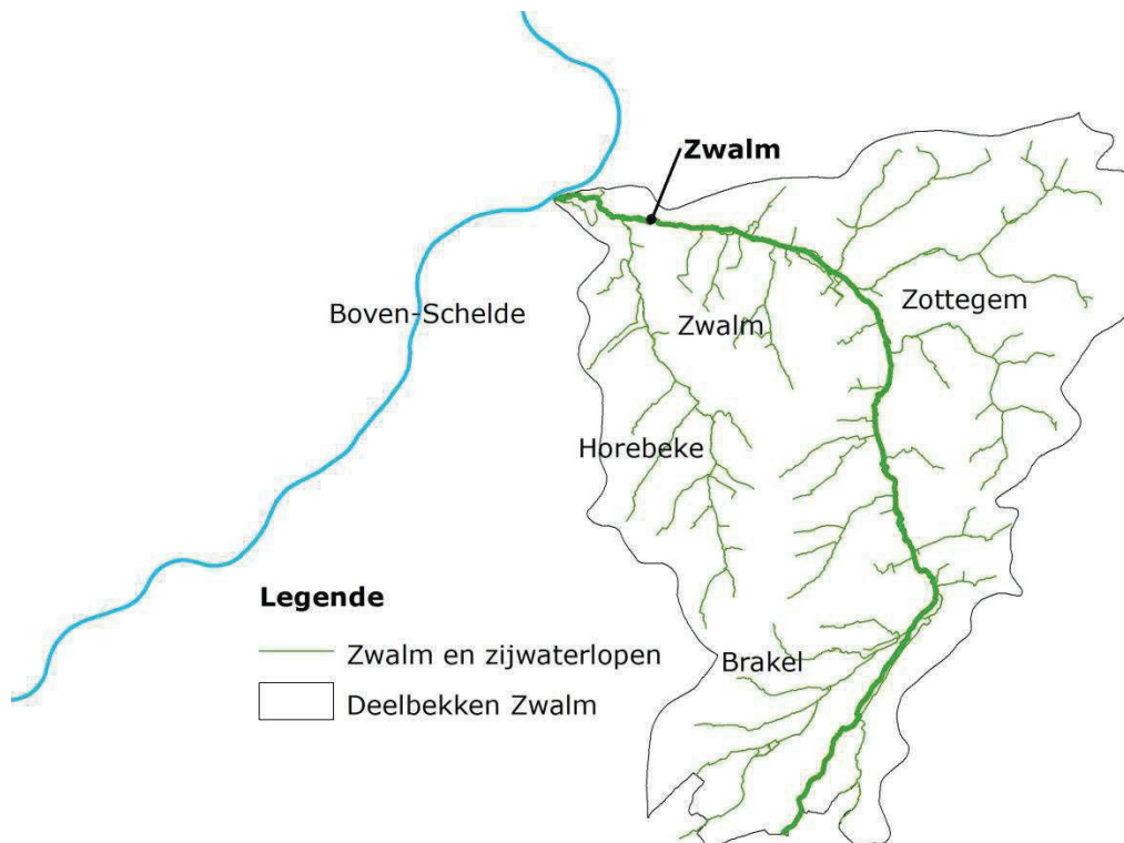
Bijlage 1. Plan met de Zwalm en zijn zijwaterlopen als vermeld in artikel 1, §1

Gezien om gevoegd te worden bij het ministerieel besluit van 1 december 2017 betreffende het instellen van een tijdelijke terugzetverplichting in de waterlopen Zwalm en IJse en hun zijwaterlopen ter uitvoering van artikel 14 van de wet van 1 juli 1954 op de riviervisserij.