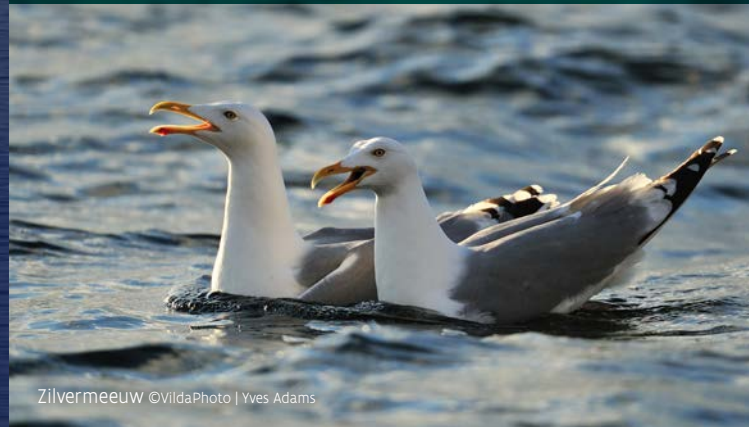
Zilvermeeuw ©VildaPhoto | Yves Adams

Kleine mantelmeeuw - ©VildaPhoto | Yves Adams