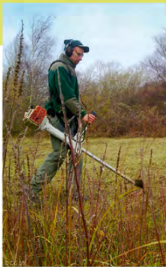
⌘ Beheer door maaien