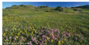
▲ grijze duinen