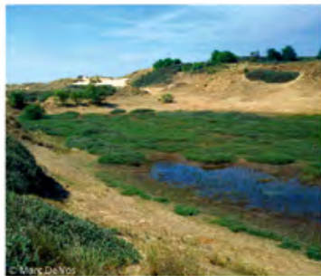
uitgestrekte vochtige pannen