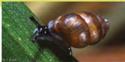
⤴ Nauwe korfslak

De maatregelen om de natuurlijke habitats en de biotopen van de bedreigde soorten te herstellen, omvatten onder andere de grootschalige verwijdering van woekerende struiken en grassen, grondwerken en de inrichting van begrazingszones. Het onderhoudsbeheer van de kusthabitats omvat maaien en laten begrazen door grazers (runderen, pony's, ezels, schapen...).