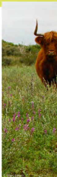
⌘ Beheer door de Highland rund