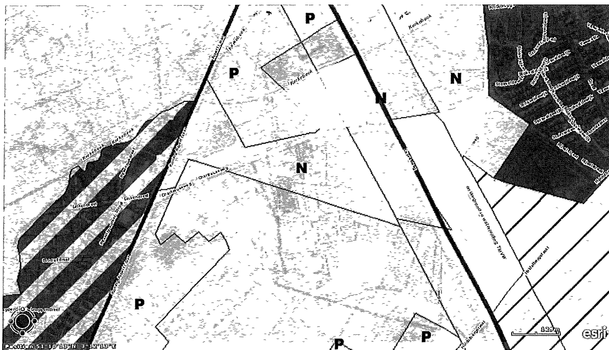
Gewestplan (aan te kopen zone in het geel)