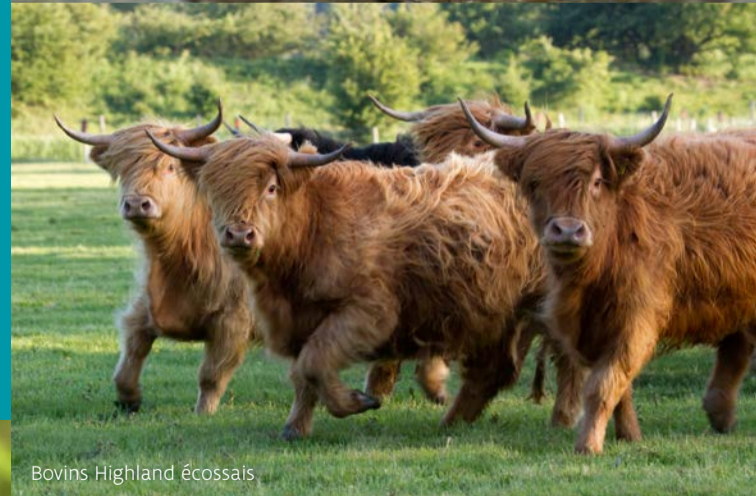
Bovins Highland écossais