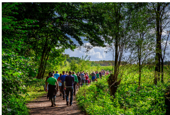
Wandelaars in het Kravaalbos

Het Kravaalbos was tot de jaren zestig rijk aan dieren en planten, die typisch zijn voor lichtrijke bossen. Je had er ijle berken- en eikenbossen. Op open plekken, aan bosranden, in bermen en graslanden trof je droge heide, brem, bloemrijke, schrale en droge graslanden aan. Veel dieren zoals de kleine ijsvogelvlinder en de hazelworm hebben die bosranden nodig. De meeste van die lichtrijke vegetaties zijn sinds de Tweede Wereldoorlog dichtgegroeid. Door landschaps- en natuurherstel zal Natuur en Bos in samenwerking met private beseigenaars inspanningen leveren om de unieke biotopen in stand te houden.