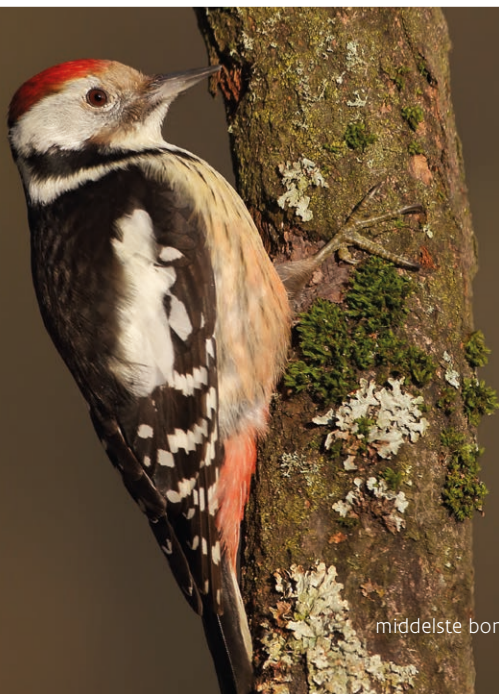
middelste bonte specht

V.U.: Jeroen Denaeghel, Agentschap voor Natuur en Bos, Havenlaan 88 bus 75, 1000 Brussel