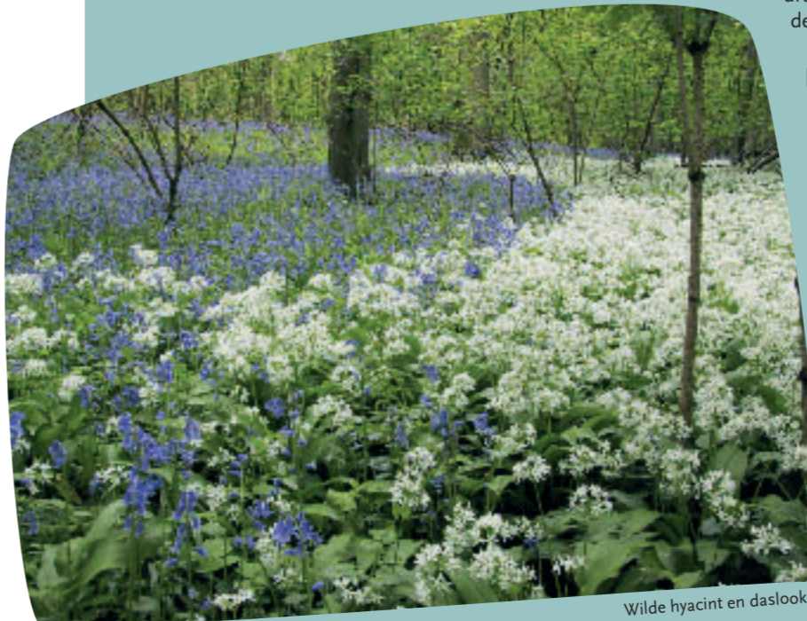
Wilde hyacint en daslook