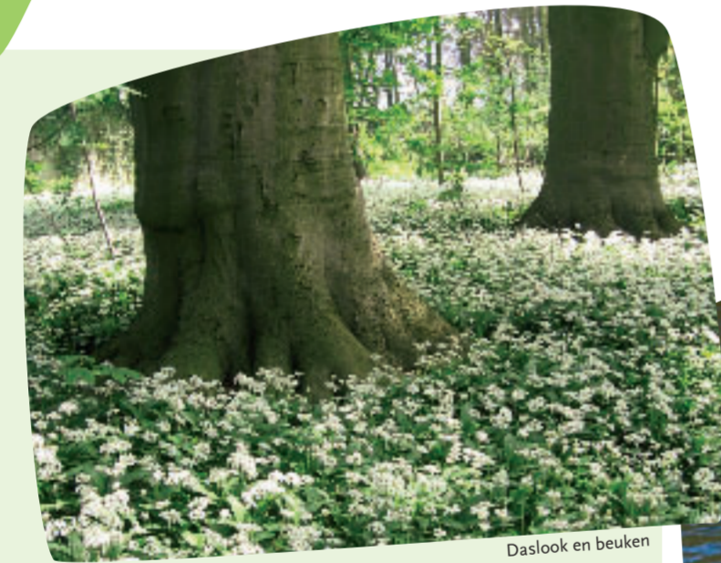
Daslook en beuken