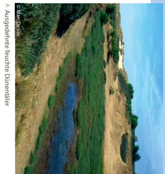
Ausgedehnte feuchte Dünentaler