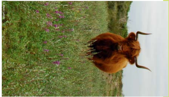
Management durch Beweidung mit Hochlandrindern