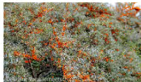
▲ dunes arbustives

Ainsi, un vaste projet transfrontalier de préservation a été mis en œuvre par les autorités françaises et flamandes avec le soutien de l'Union Européenne : le projet LIFE+Nature FLANDRE (Flemish And North-french Dunes REstoration) avec un budget total de 4 066 454 €, dont 50 % cofinancé par l'Union Européenne et une durée de 5 ans, du 02/09/2013 au 01/09/2018. LIFE est l'acronyme de L'Instrument Financier européen pour l'Environnement.