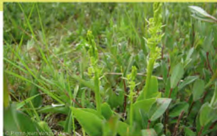
⤴ Liparis de Loesel

Sur les milliers d'hectares d'espaces naturels des côtes flamandes, une grande partie a été détruite pour des raisons diverses : urbanisation, industrialisation, intensification de l'agriculture... Dans les années 70, la nécessaire sauvegarde de ces milieux dunaires de part et d'autre de la frontière a amené les différents acteurs à mettre en œuvre des actions de protection et de préservation. Aujourd'hui, en Flandre maritime, les partenaires belges et français, l'Agence Nature et Forêts de la Région flamande, le Département du Nord et le Conservatoire du Littoral et des Rivages Lacustres, s'associent pour renforcer ces actions.