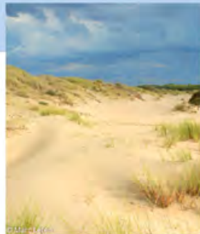
▲ dunes blanches

Toute cette diversité bénéficie d'un classement en Zone Natura 2000, autant pour la conservation de nombreuses espèces d'oiseaux (Directive européenne Oiseaux) qui trouvent, dans les dunes, sur l'estran, les vasières et les prés salés, repos et nourriture... que pour celle de ses habitats naturels spécifiques pour les côtes atlantiques (Directive européenne Habitats).