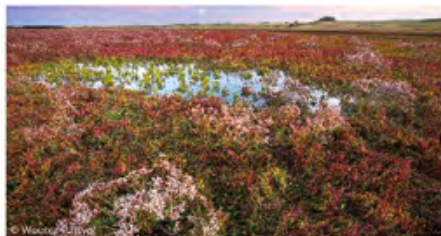
▲ prés salés (schorre)

Les vents dominants de Nord-Ouest ont modelé les dunes de type "flamand", c'est-à-dire des dunes en forme de parabole ou de fer à cheval très larges qui entourent des pannes humides.