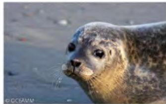
⌘ Phoque veau marin