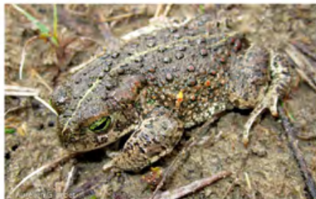
⤴ Crapaud calamite