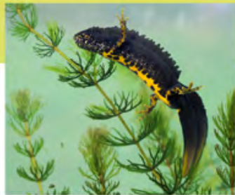
⌘ Triton crêté

Les mesures de restauration des habitats naturels et des biotopes des espèces menacées intègrent entre autres des travaux conséquents de débroussaillage, de terrassement et l'établissement de zones de pâturage. La gestion courante des habitats dunaires comprend le fauchage et le pâturage par de grands herbivores (vaches, poneys, ânes, moutons...).