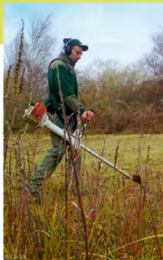
⤴ Gestion par fauchage