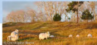
▲ dunes fossiles