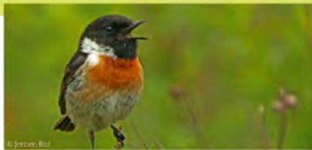
⌘ Tarier pâtre