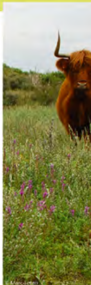
⤴ Gestion par pâture vache Highland