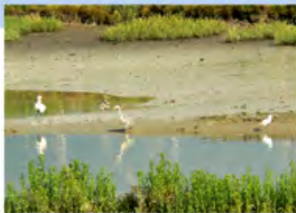
▲ vasières (slikke)