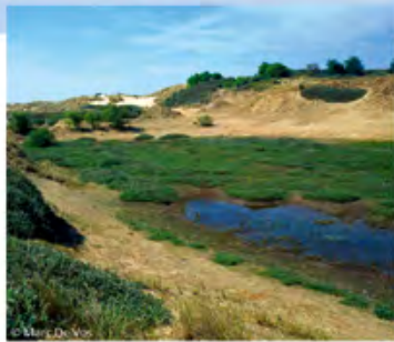
▲ pannes humides étendues