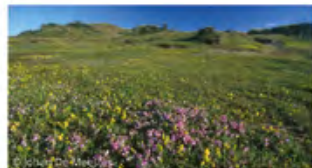
▲ dunes grises