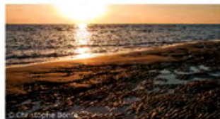
▲ estrans de sable