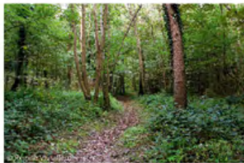
▲ dunes boisées

Les dunes littorales flamandes constituent des espaces naturels et des paysages de première importance. Leur intérêt écologique et paysager a justifié la mise en place de mesures de protection.