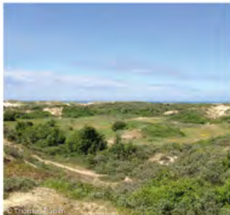
▲ dunes "paraboliques"

Les espaces dunaires sont, aujourd'hui, discontinus et forment des sanctuaires de nature le plus souvent entourés par des zones urbaines. Plusieurs facteurs concourent à leur embroussaillage ce qui entraîne une perte de biodiversité.